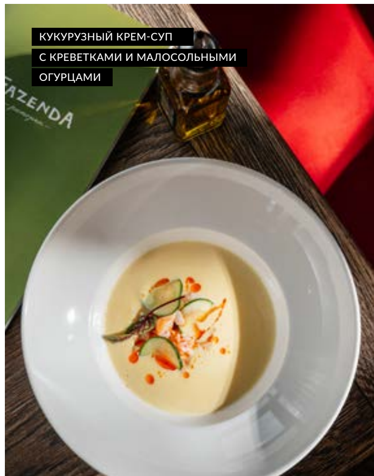
КУКУРУЗНЫЙ КРЕМ-СУП С КРЕВЕТКАМИ И МАЛОСОЛЬНЫМИ ОГУРЦАМИ