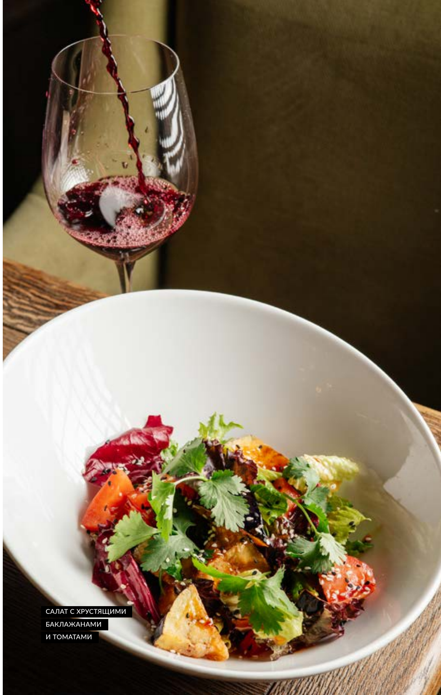
САЛАТ С ХРУСТЯЩИМИ БАКЛАЖАНАМИ И ТОМАТАМИ