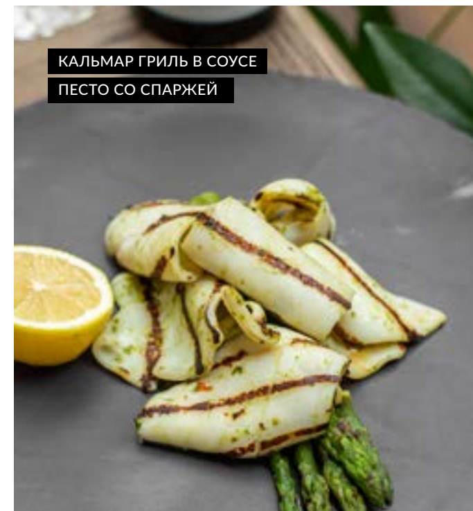
КАЛЬМАР ГРИЛЬ В СОУСЕ ПЕСТО СО СПАРЖЕЙ