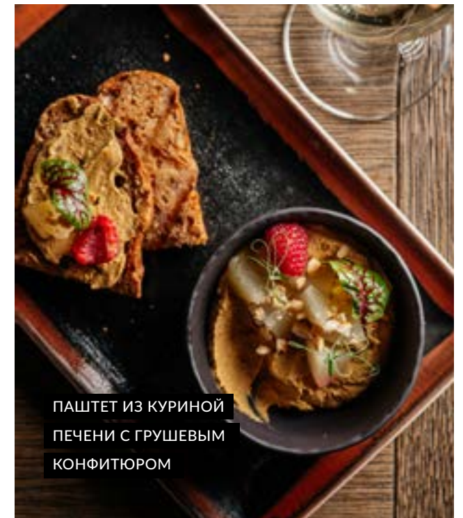
ПАШТЕТ ИЗ КУРИНОЙ ПЕЧЕНИ С ГРУШЕВЫМ КОНФИТЮРОМ