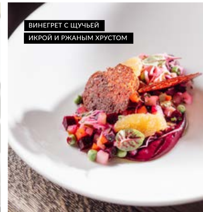
ВИНЕГРЕТ С ЩУЧЬЕЙ ИКРОЙ И РЖАНЫМ ХРУСТОМ