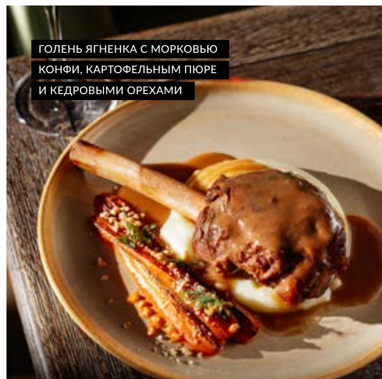
ГОЛЕНЬ ЯГНЕНКА С МОРКОВЬЮ КОНФИ, КАРТОФЕЛЬНЫМ ПЮРЕ И КЕДРОВЫМИ ОРЕХАМИ