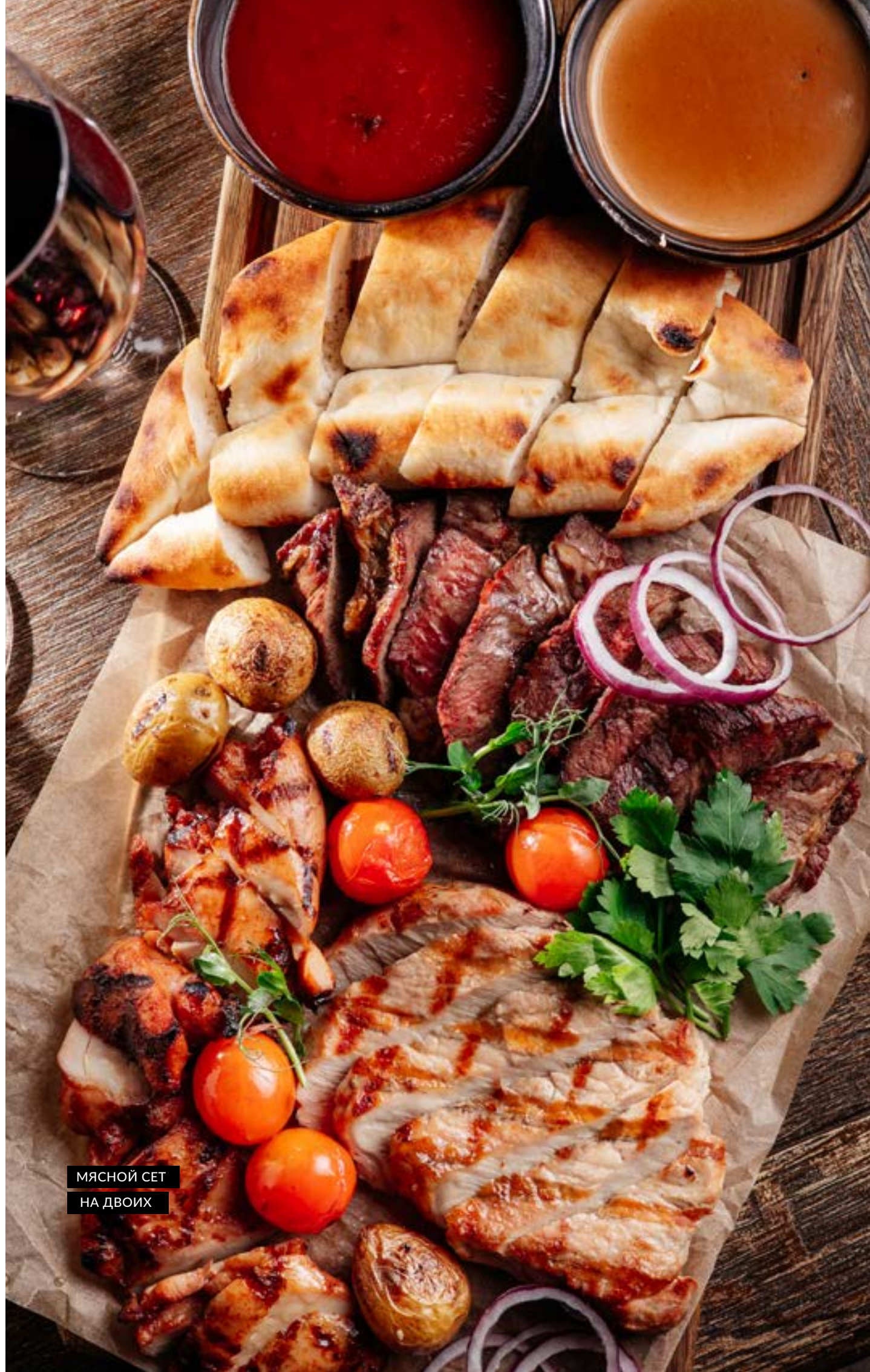
МЯСНОЙ СЕТ НА ДВОИХ