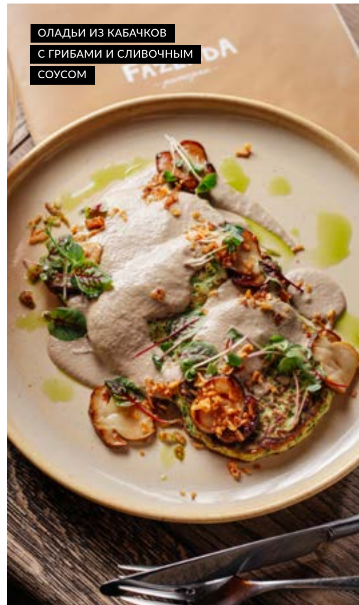
ОЛАДЬИ ИЗ КАБАЧКОВ С ГРИБАМИ И СЛИВОЧНЫМ СОУСОМ