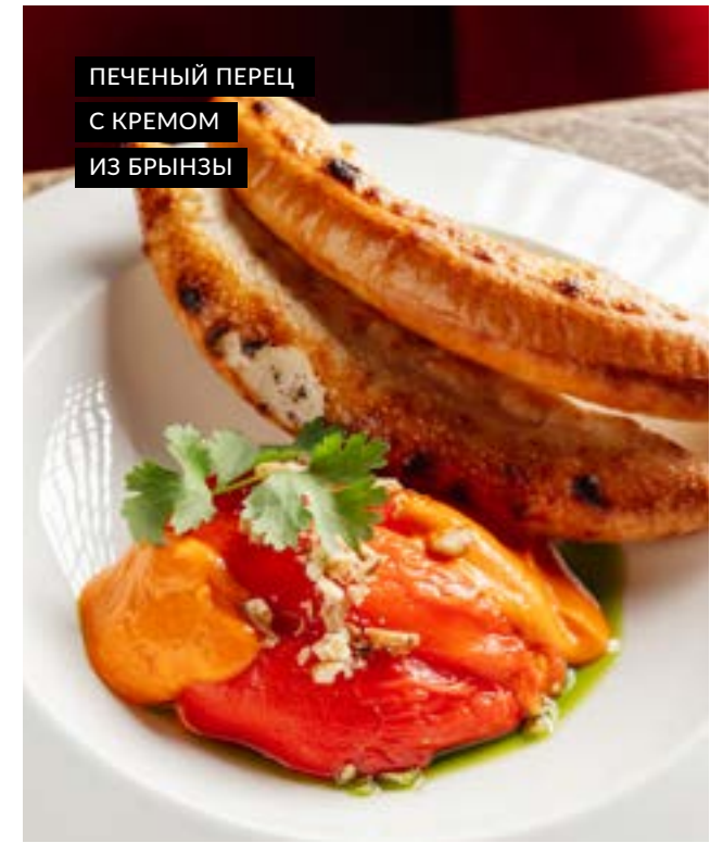
ПЕЧЕНЬ ПЕРЕЦ С КРЕМОМ ИЗ БРЫНЗЫ