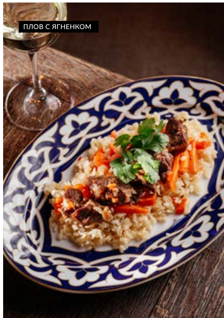
ПЛОВ С ЯГНЁНКОМ