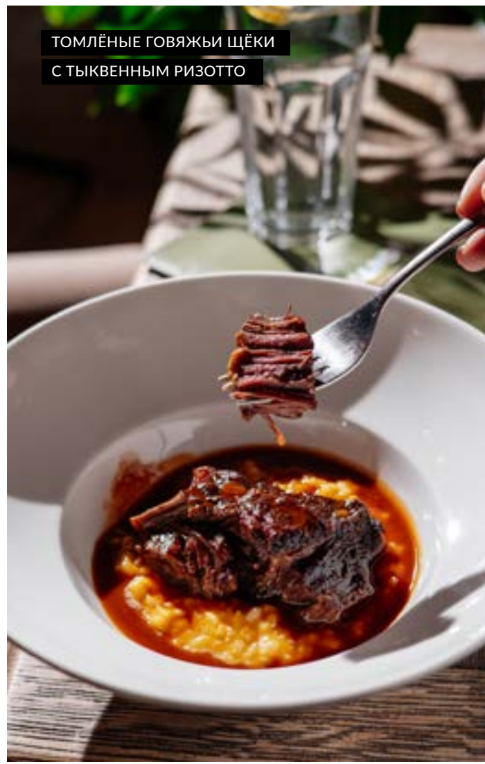
ТОМЛЁНЫЕ ГОВЯЖЬИ ЩЁКИ С ТЫКВЕННЫМ РИЗОТТО