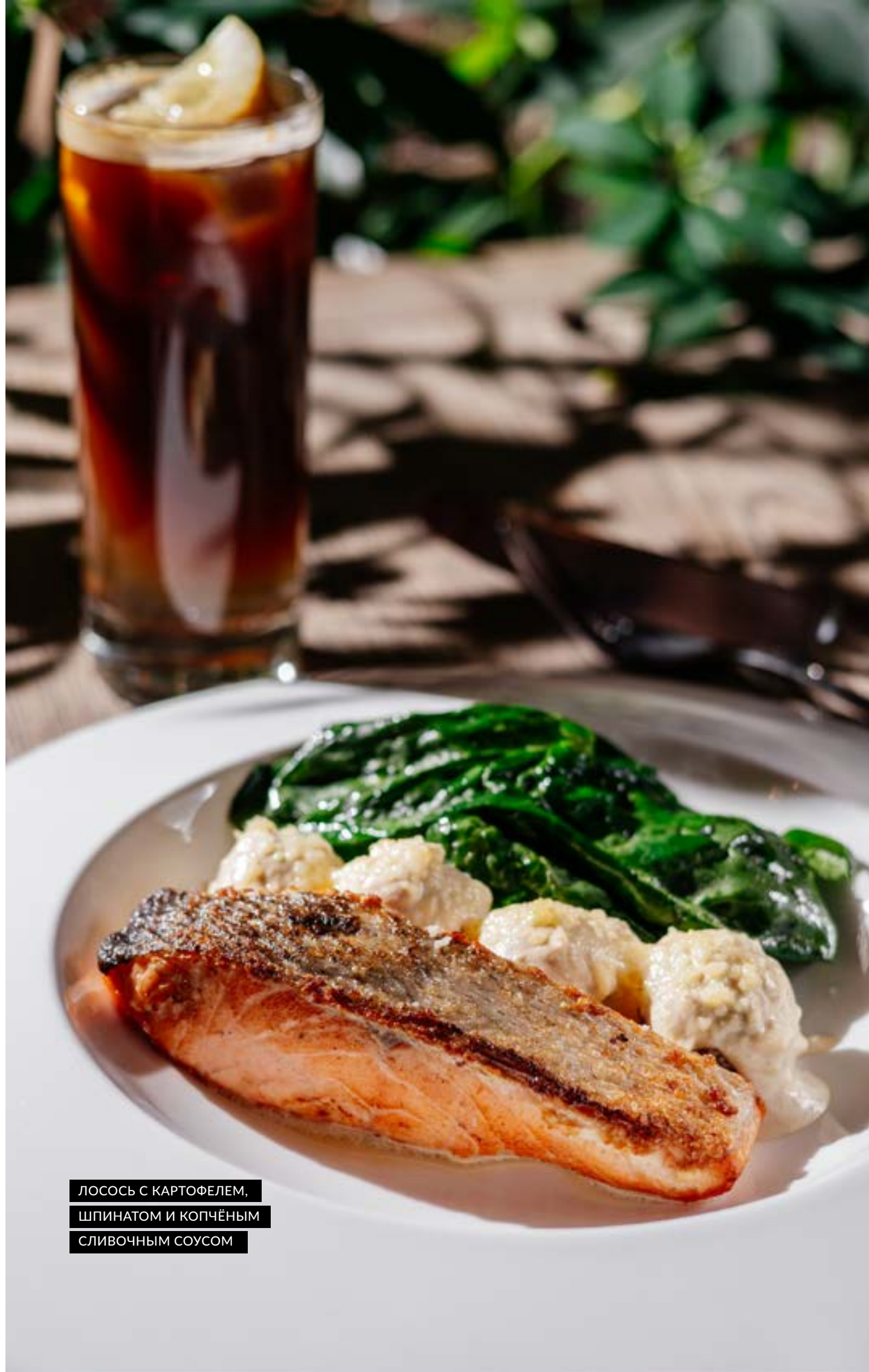
ЛОСОСЬ С КАРТОФЕЛЕМ, ШПИНАТОМ И КОПЧЁНЫМ СЛИВОЧНЫМ СОУСОМ