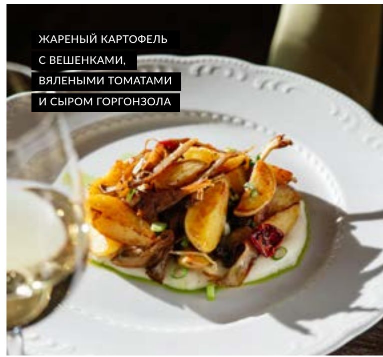
ЖАРЕННЫЙ КАРТОФЕЛЬ С ВЕШЕНКАМИ, ВЯЛЕНЫМИ ТОМАТАМИ И СЫРОМ ГОРГОНЗОЛА