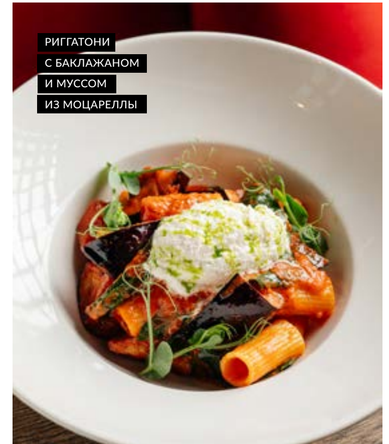
РИГГАТОНИ С БАКЛАЖАНОМ И МУССОМ ИЗ МОЦАРЕЛЛЫ