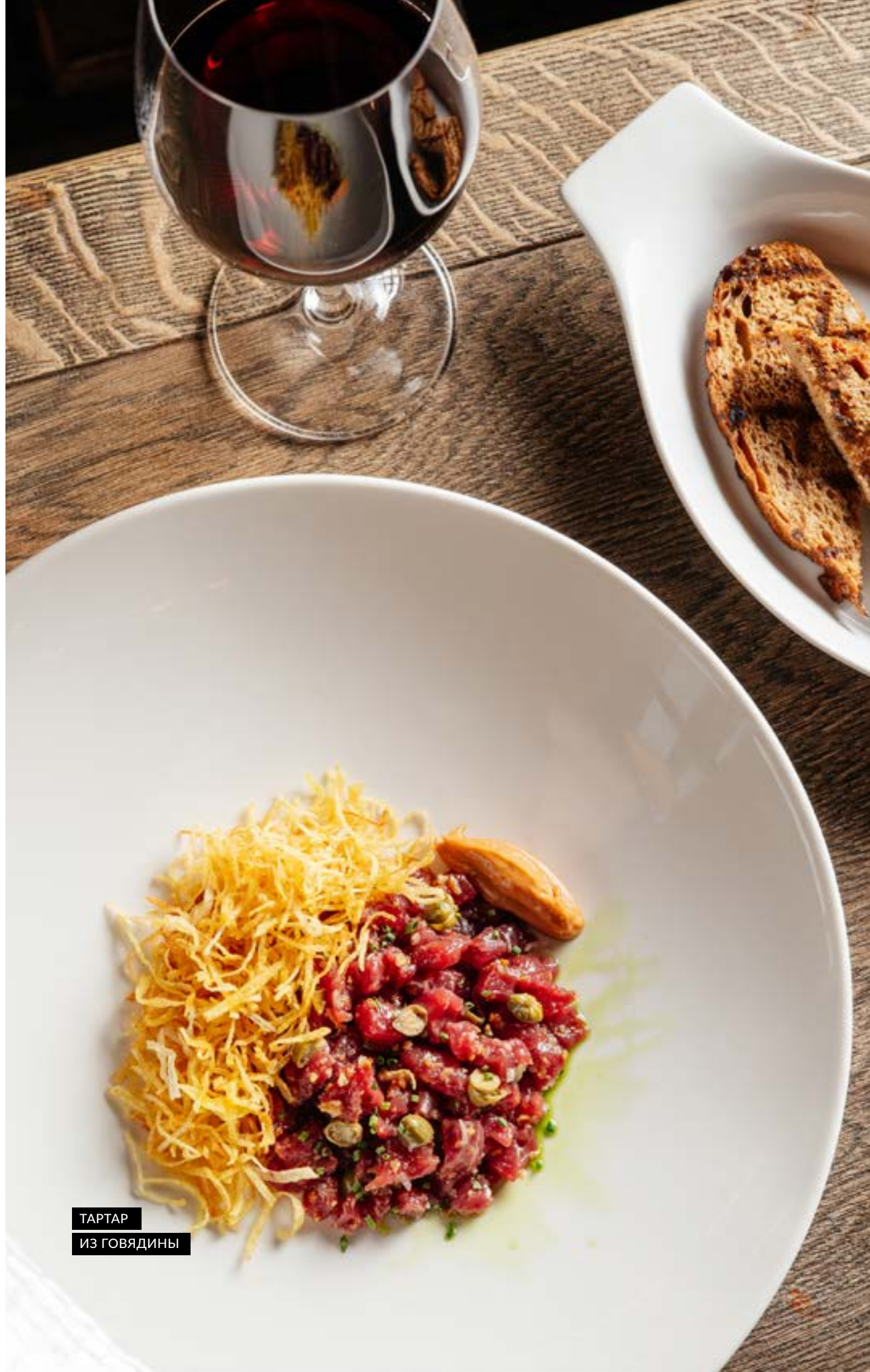
ТАРТАР ИЗ ГОВЯДИНЫ