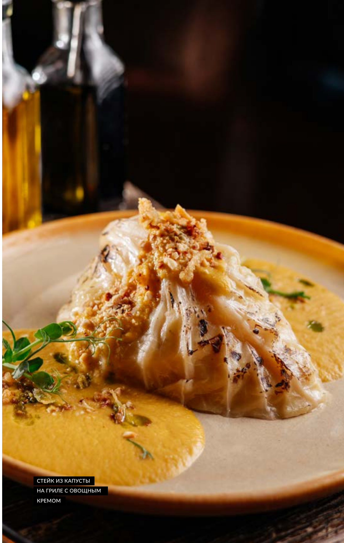
СТЕЙК ИЗ КАПУСТЫ НА ГРИЛЕ С ОВОЩНЫМ КРЕМОМ