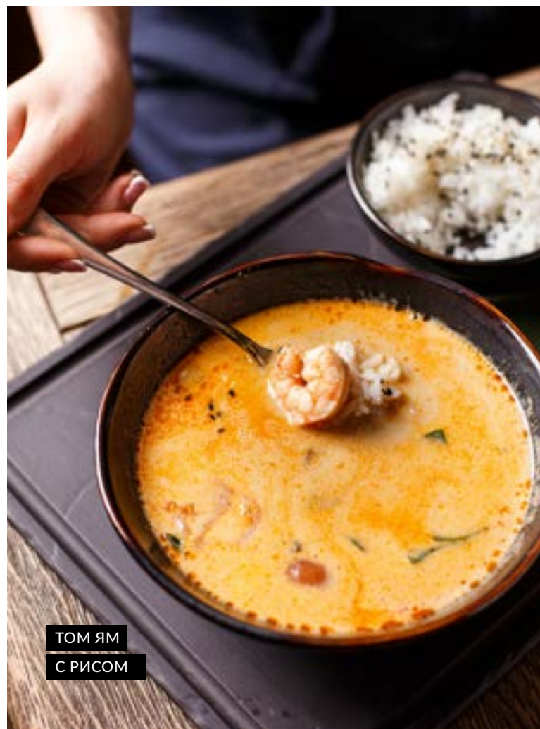
ТОМ ЯМ С РИСОМ