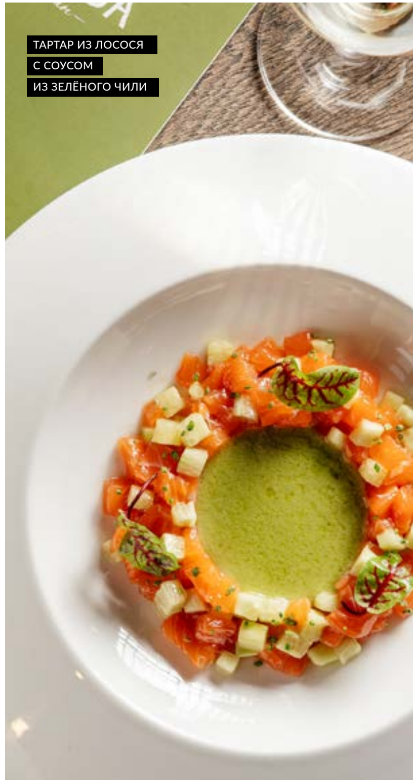
ТАРТАР ИЗ ЛОСОСЯ С СОУСОМ ИЗ ЗЕЛЁНОГО ЧИЛИ