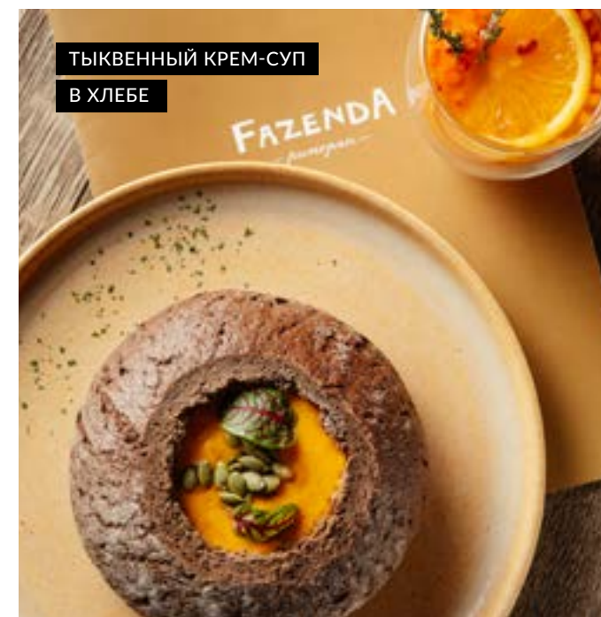
ТЫКВЕННЫЙ КРЕМ-СУП В ХЛЕБЕ