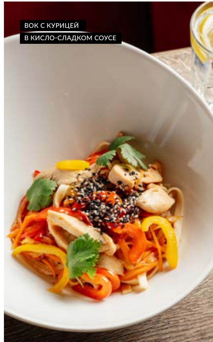
ВОК С КУРИЦЕЙ В КИСЛО-СЛАДКОМ СОУСЕ