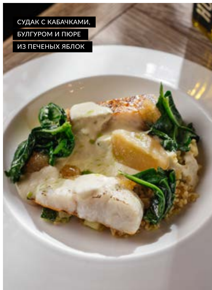
СУДАК С КАБАЧКАМИ, БУЛГУРОМ И ПЮРЕ ИЗ ПЕЧЕНЫХ ЯБЛОК