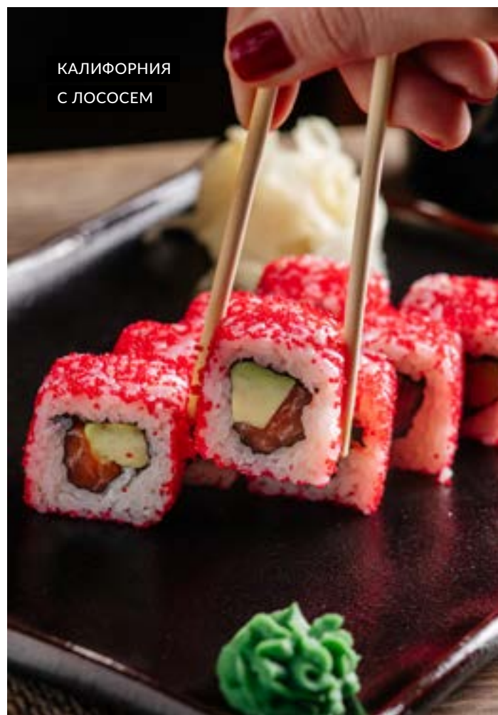
КАЛИФОРНИЯ С ЛОСОСЕМ