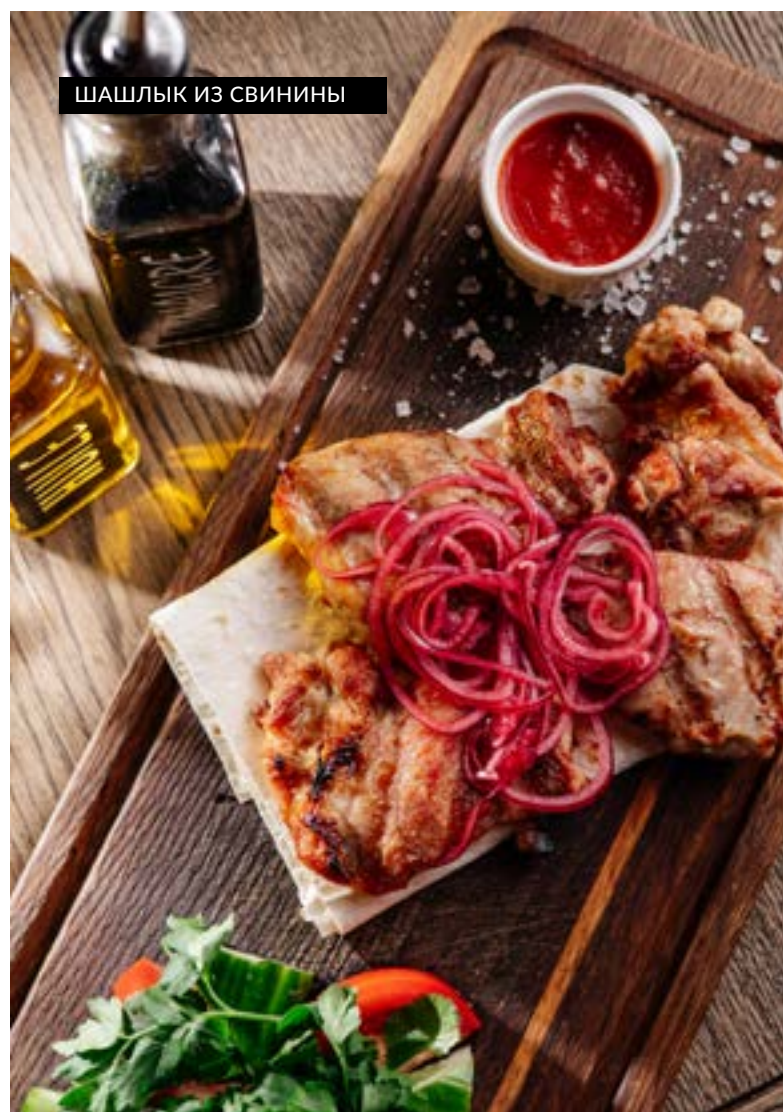
ШАШЛЫК ИЗ СВИНИНЫ