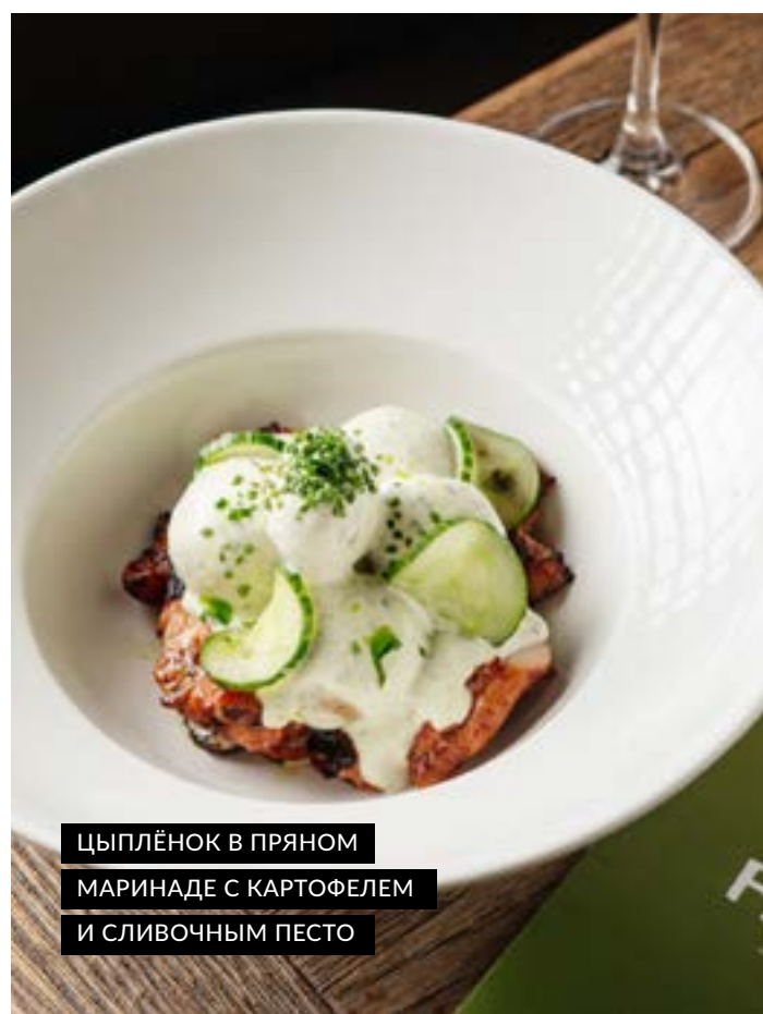
ЦЫПЛЁНОК В ПРЯНОМ МАРИНАДЕ С КАРТОФЕЛЕМ И СЛИВОЧНЫМ ПЕСТО