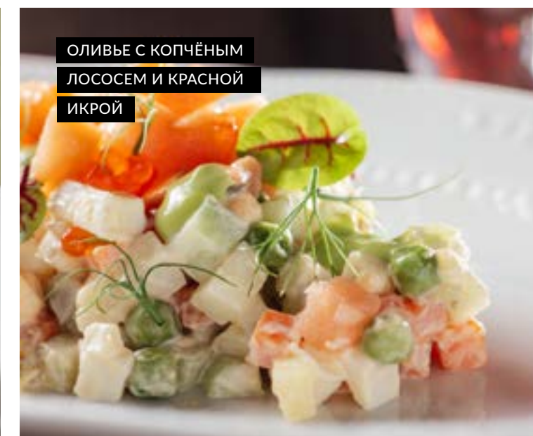
ОЛИВЬЕ С КОПЧЕНЫМ ЛОСОСЕМ И КРАСНОЙ ИКРОЙ