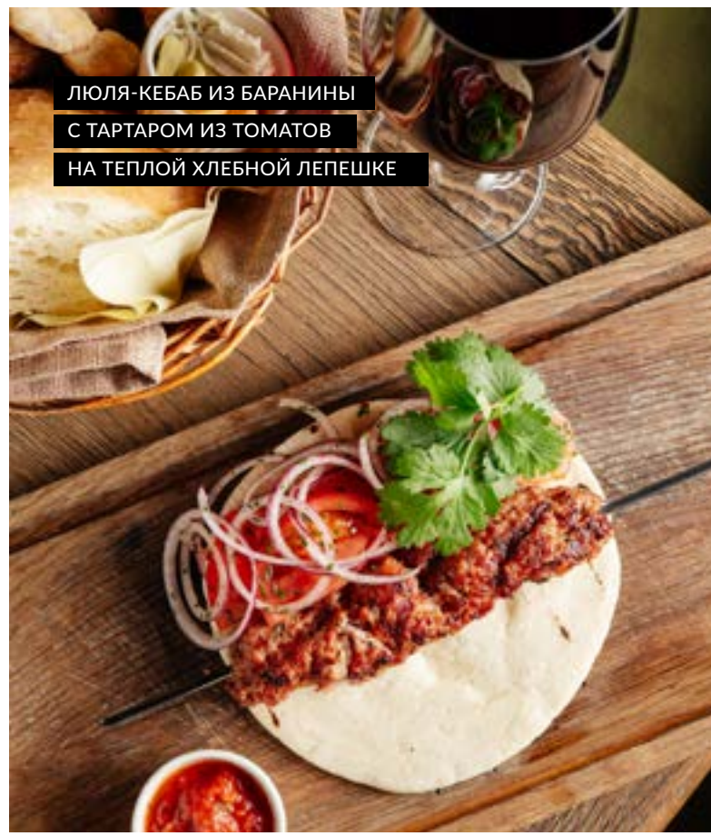
ЛЮЛЯ-КЕБАБ ИЗ БАРАНИНЫ С ТАРТАРОМ ИЗ ТОМАТОВ НА ТЕПЛОЙ ХЛЕБНОЙ ЛЕПЕШКЕ