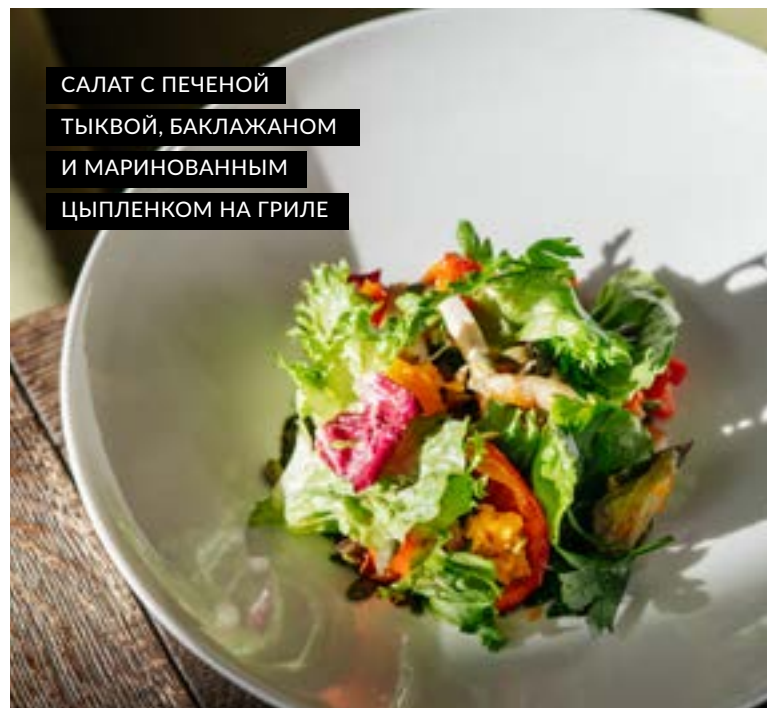
САЛАТ С ПЕЧЕНОЙ ТЫКВОЙ, БАКЛАЖАНОМ И МАРИНОВАННЫМ ЦЫПЛЕНКОМ НА ГРИЛЕ