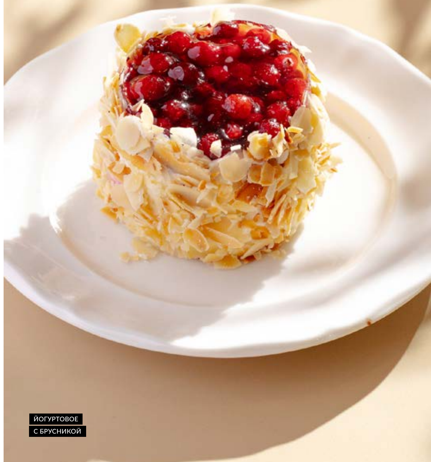
ЙОГУРТОВОЕ С БРУСНИКОЙ