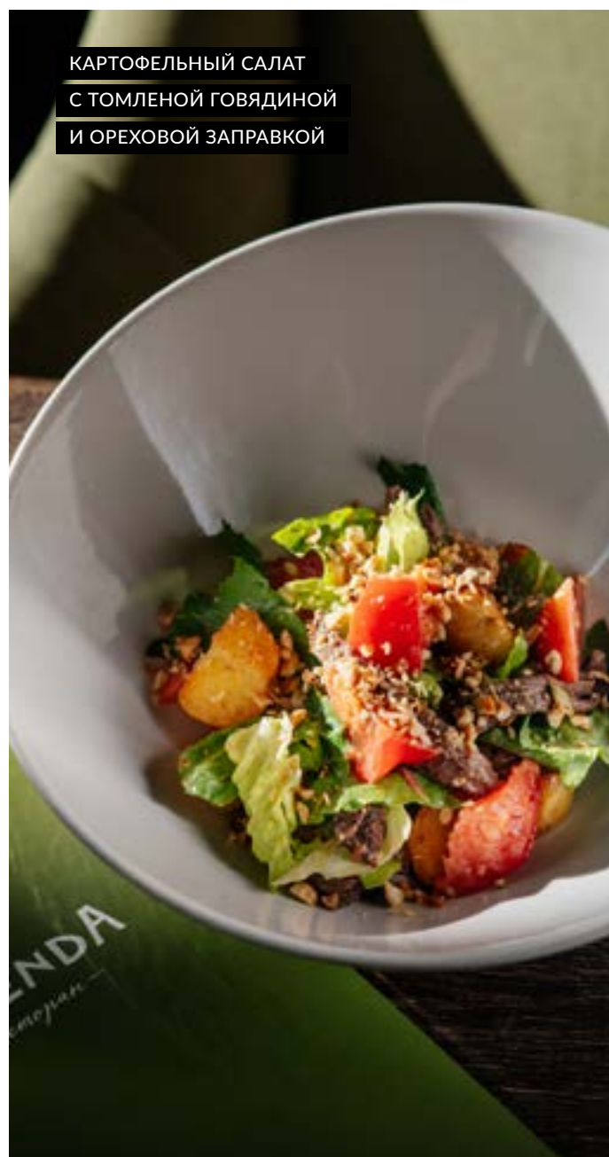
КАРТОФЕЛЬНЫЙ САЛАТ С ТОМЛЕННОЙ ГОВЯДИНОЙ И ОРЕХОВОЙ ЗАПРАВКОЙ